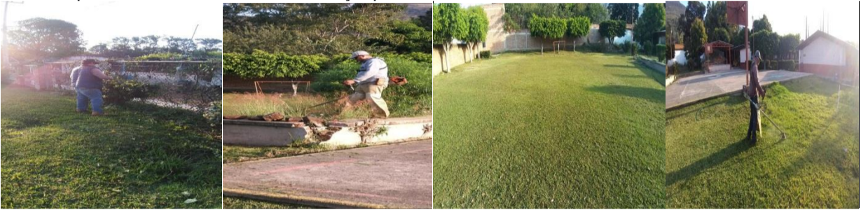
Localidad de palo blanco mantenimiento de cancha y áreas verdes