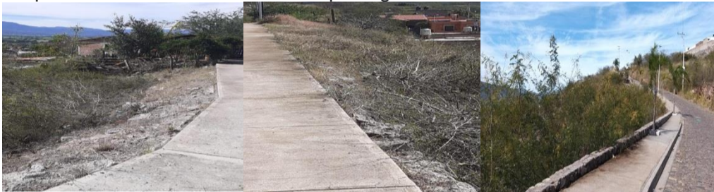
Parque Gabilondo Soler