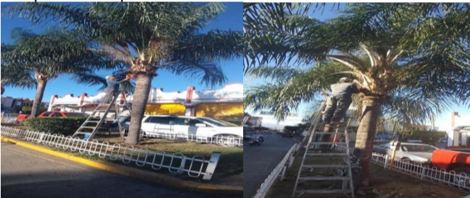
Mantenimiento en áreas verdes col. Colomitos