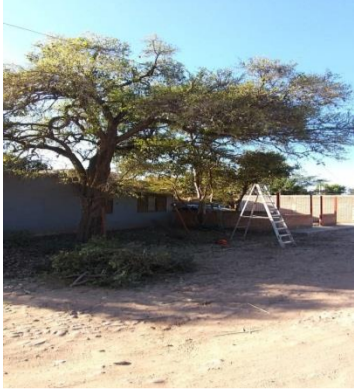
Calle Terreros Azules #850