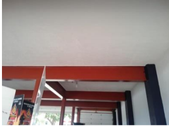
Escuela Hermenegildo Galeana