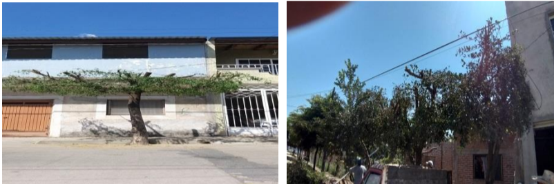
López Rayón fuera de la escuela niños héroes