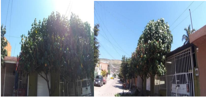
Calle Herlinda Mancilla #2A