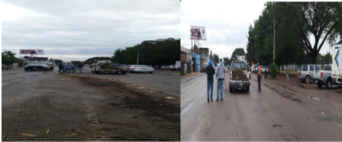
Limpieza de maleza camino a col. El pedregal