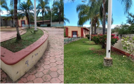
Escuela primaria 20 de noviembre de Ayuquila