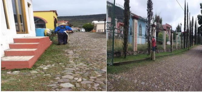
Limpieza del periférico

Mantenimiento en áreas verdes cementerio municipal