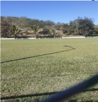
Mantenimiento de canchas de beisbol, cancha las gradas y básquetbol