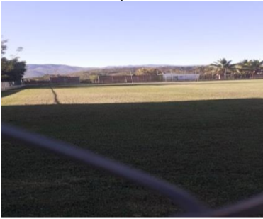
Cancha Localidad del Aguacate